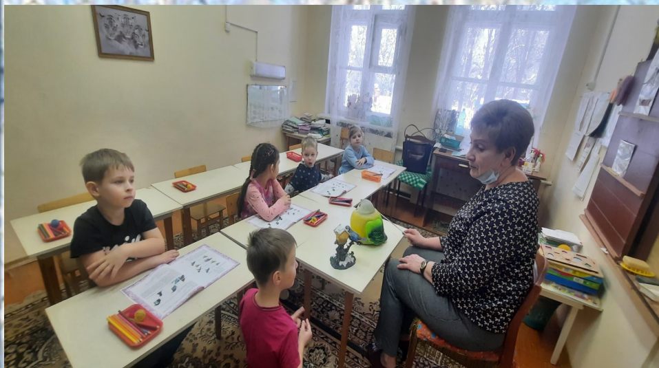
НОД «Зимующие птицы»