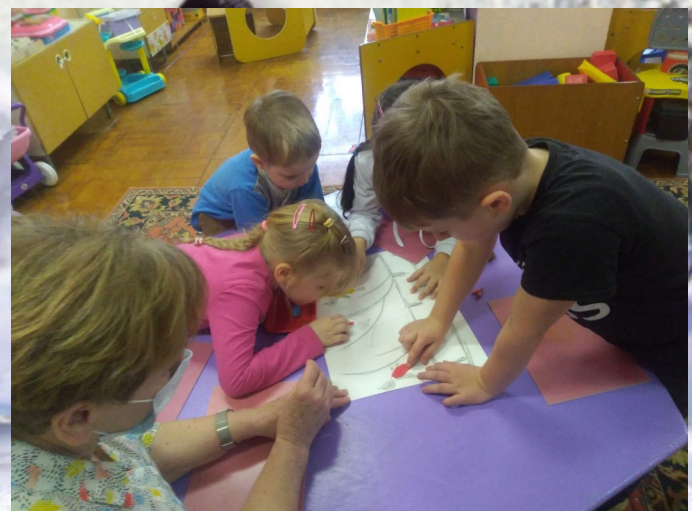
Пластилинография «Снегири и синицы на березе»